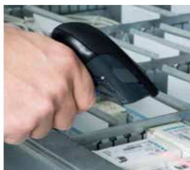
Čtečka čárového kódu 1D a 2D