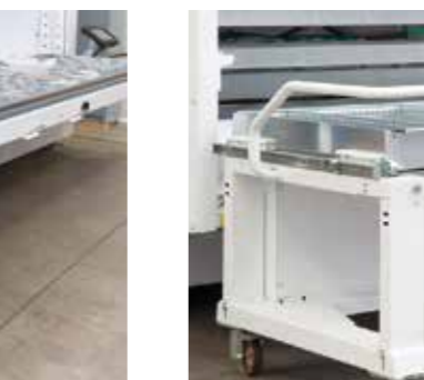
Vozík pro manipulaci s policemi