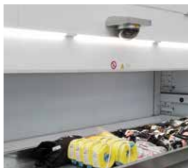
LED osvětlení externího okna