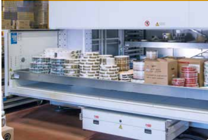
EXTERNÍ JEDNOÚROVŇOVÉ OKNO