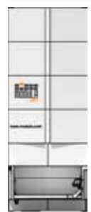
← 2 317 mm →