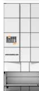
← 2 917 mm →