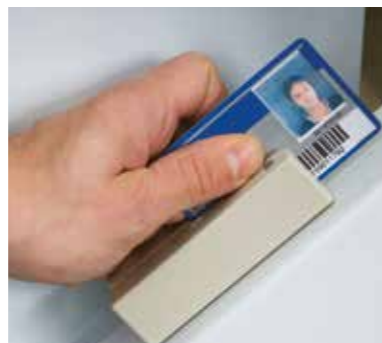
Čtečka karet s magnetickým proužkem