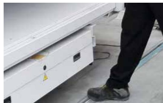
Pedál na dokončení odběru