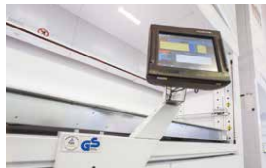
Posuvný ovládací panel