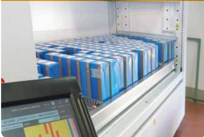
INTERNÍ JEDNOÚROVŇOVÉ OKNO