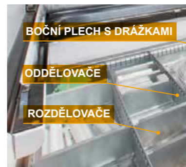
Příslušenství k policím