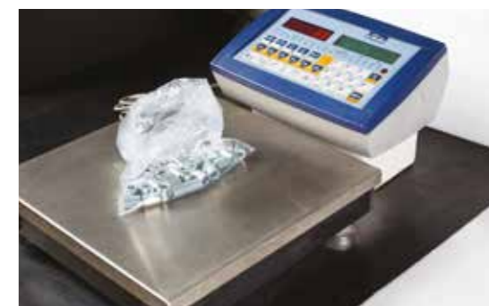
Váha na počítání kusů