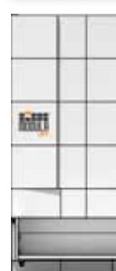
← 4 517 mm →