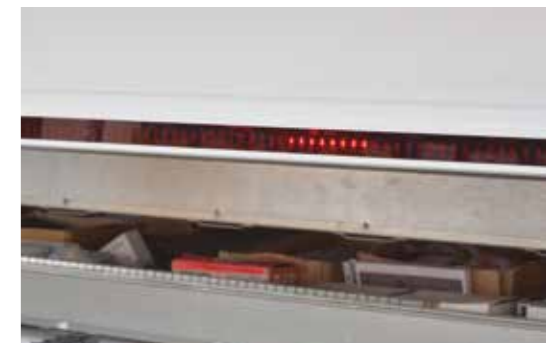
LED diodová lišta