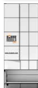
← 3 517 mm →