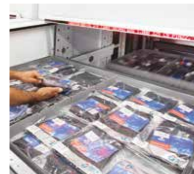
Alfanumerický panel s údaji