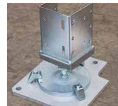
Podložky na rozložení hmotnosti