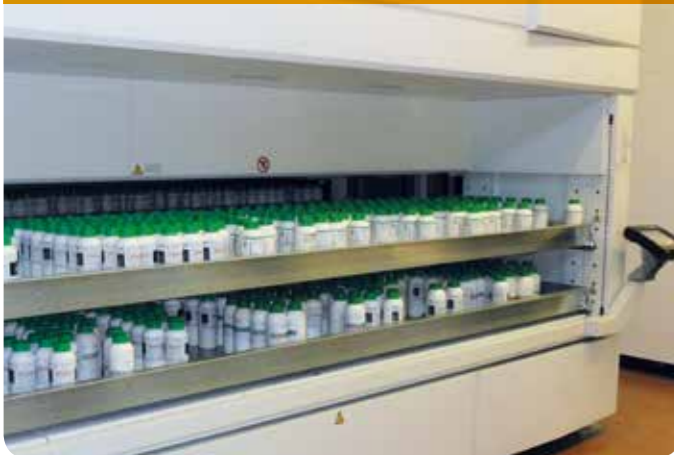
INTERNÍ DVOUÚROVŇOVÉ OKNO