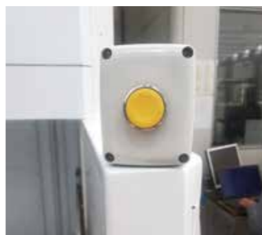
Tlačítko na dokončení odběru