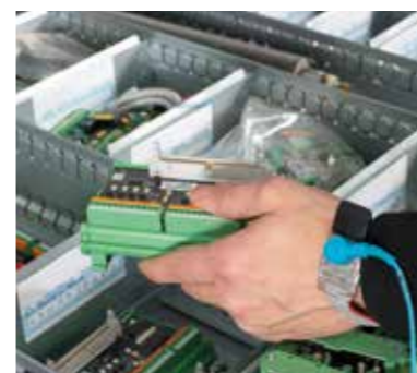
Systém ochrany ESD